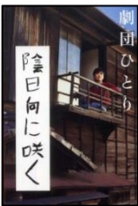
『陰日向に咲く』 劇団ひとり・幻冬舎