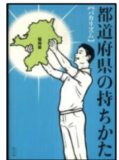
『都道府県の持ちかた』 バカリズム・ポプラ社