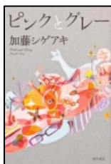
『ピンクとグレー』 加藤シゲアキ KADOKAWA