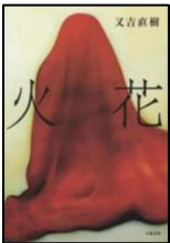
『火花』 又吉直樹・文藝春秋