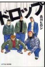
『ドロップ』 品川ヒロシ リトルモア