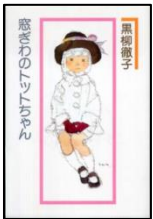
『窓ぎわのトットちゃん』黒柳徹子・講談社 『天音。』EXILE ATSUSHI 幻冬舎